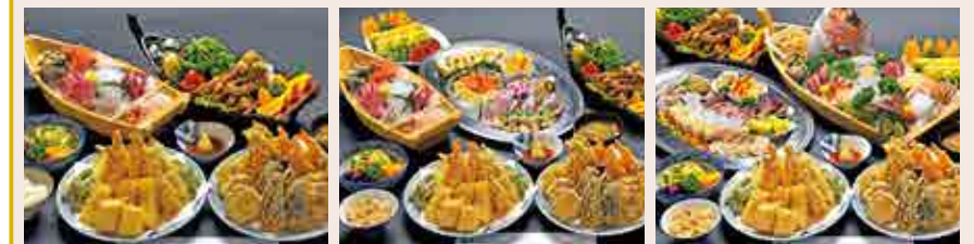
↑10,000 yen(5 person sashimi assortment) ↑12,000 yen ↑15,000 yen

※ For elementary school children the Edomae Plan is 6000 yen/per person(tax not included) For junior high school students the Edomae Plan is 8000 yen and for other plans there is a 20% discount.